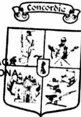
Gobierno del Municipio Presidencia Municipal